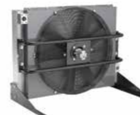
铝板翅式风冷散热器