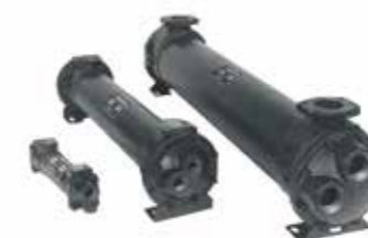
管壳式水冷散热器